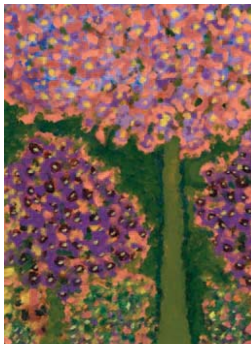
Will Vissers, Boom in de lente, 1991, olieverf, 40 x 30 cm

Uit: regen kun je ruiken NZV Uitgevers www.nzv.nl