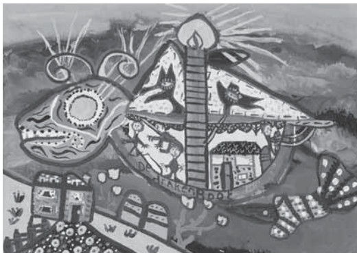
Mariëtte Keune, De drakenboot, acryl, 35 x 50 cm