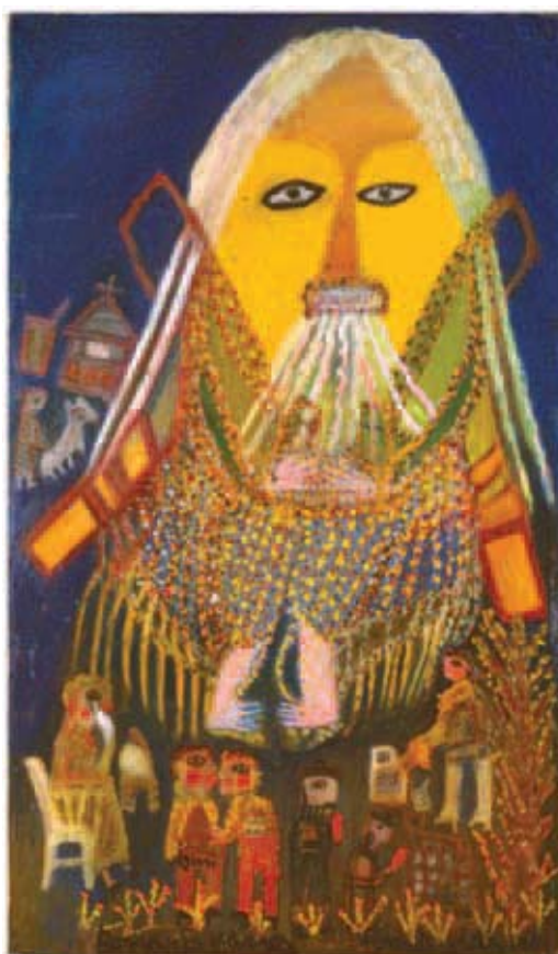
Bonaria Manca, Divinita del giardino della vita, ca. 2000, olieverf op vezelplaat, 57x 97 cm