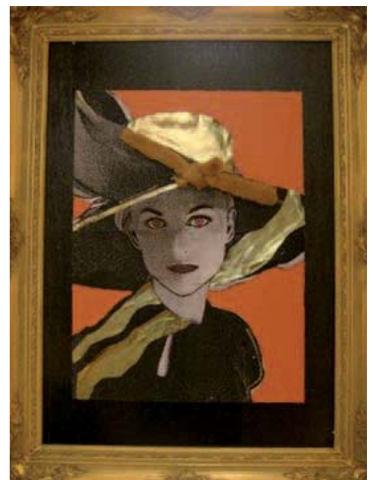
T. Hamstra brengt afbeeldingen uit tijdschriften, stof en andere materialen samen tot een nieuwe vorm