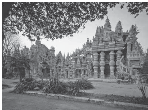
Palais Idéal, Hauterives, Frankrijk